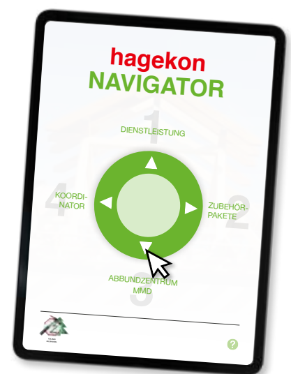
hagekon: das Planungsnetzwerk des Holzbau Fachhandels

Was ist hagekon? Ein Planungsnetzwerk für die Holzbauplanung, Arbeitsvorbereitung, Schall- und Brandschutzfragen. Fragen Sie bitte Ihren Fachhandelsstandort!