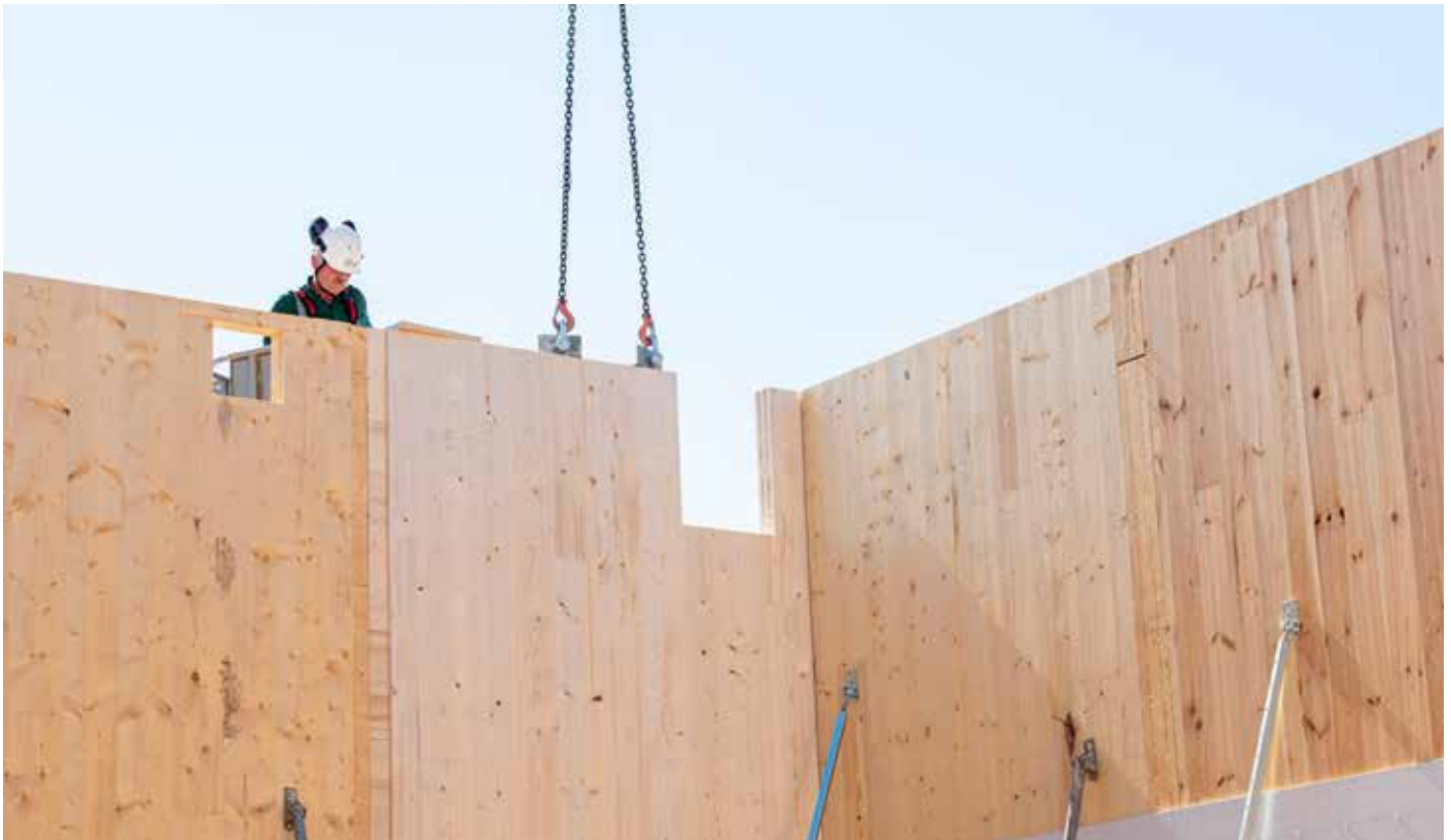
Fertige Holzbauteile, hier in Form von Brettsperrholz (CLT)