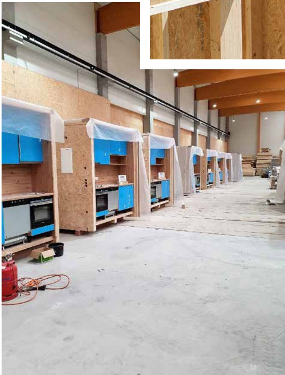
Fertige Bad- und Küchenmodule mit tragender Funktion

Digitalisierung im Bauwesen heißt digitale Planung, digitale Produktion, digitale Formfindung und das digitale Bauen (BIM). Dies stellt viele Zimmerbetriebe vor eine enorme Herausforderung. Nicht jeder kann hier sein digitales Bausystem aufbauen. Aber ein Netzwerk kann hier helfen und Teile der Planung auslagern. Mit hagekon haben wir in der hagebau ein funktionierendes Netzwerk.